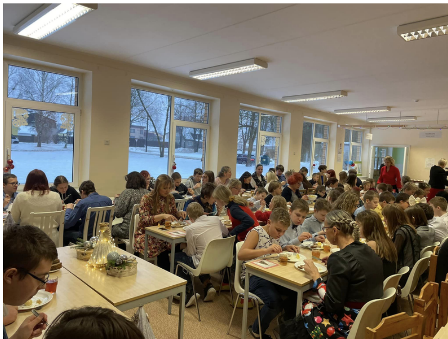
Koolipere ühine jõululõuna enne jõulupidu