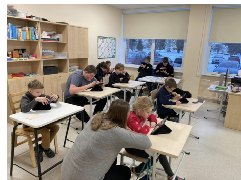
Hetki töötubadest, mille olid ettevalmistanud meie enda kooli õpetajad.