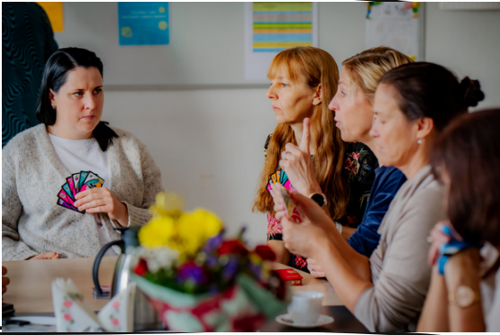
Samal ajal, kui õpilased tunnis olid, said õpetajad lauamänge mängida

7. oktoobril tähistasime enda koolis õpetajate päeva. Samal ajal, kui õpetajad said õpetajate toas lauamänge mängida, olid klasside ees hoopis 8. ja 9. klassi õpilased. Nii mõnigi õpilane tõdes, et õpetaja töö on raske aga põnev. Päev lõppes aktusega, kus meid käisid oma laulude ja tantsudega rõõmustamas külalised lasteaed Karlssonist.